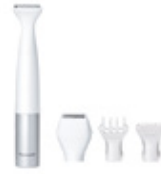
Máy tıra lông vùng bikini ES-WV60-S201