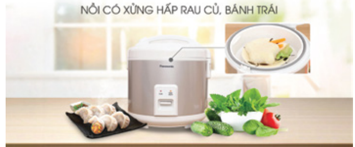
NỒI CÓ XUNG HẤP RAU CỦ, BÁNH TRÁI