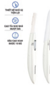
Máy cạo tıra lông mày Panasonic ES-WF61-W401